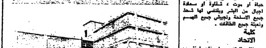
المبنى الجديد لمعهد الحكمة الذي تم تشييده امس